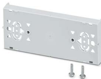
CATAN DISPLAY MOUNT Kit de montage