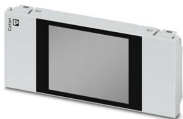
CATAN CONTROL PANEL Écran LCD