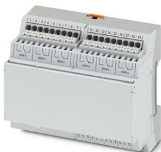
CATAN DOR6 UI8 Jusqu'à 16 Module E/S déportable à 300m Communication IP à 1 Go